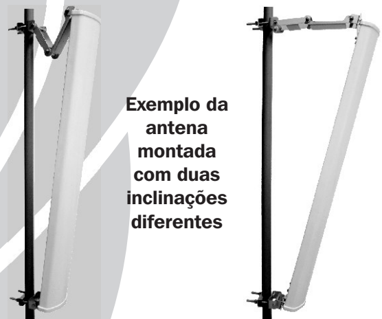
Exemplo da antena montada com duas inclinações diferentes