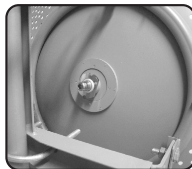
Visão traseira da antena

1. Fixe o Alimentador da Antena ao Disco usando as peças como na foto abaixo: