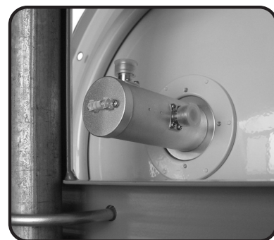
Visão traseira da antena

OBS: Essa antena é projetada para utilizar as duas polarizações simultaneamente, utilizando equipamentos com este recurso. Você também pode utilizar a antena na Polarização Vertical ou Horizontal, porém lembre-se de isolar uma das conexões que não será utilizada.